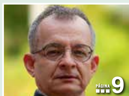
IVAN CONTRERAS TORRES: UN BAJO QUE RESUENA EN LA INDUSTRIA MUSICAL