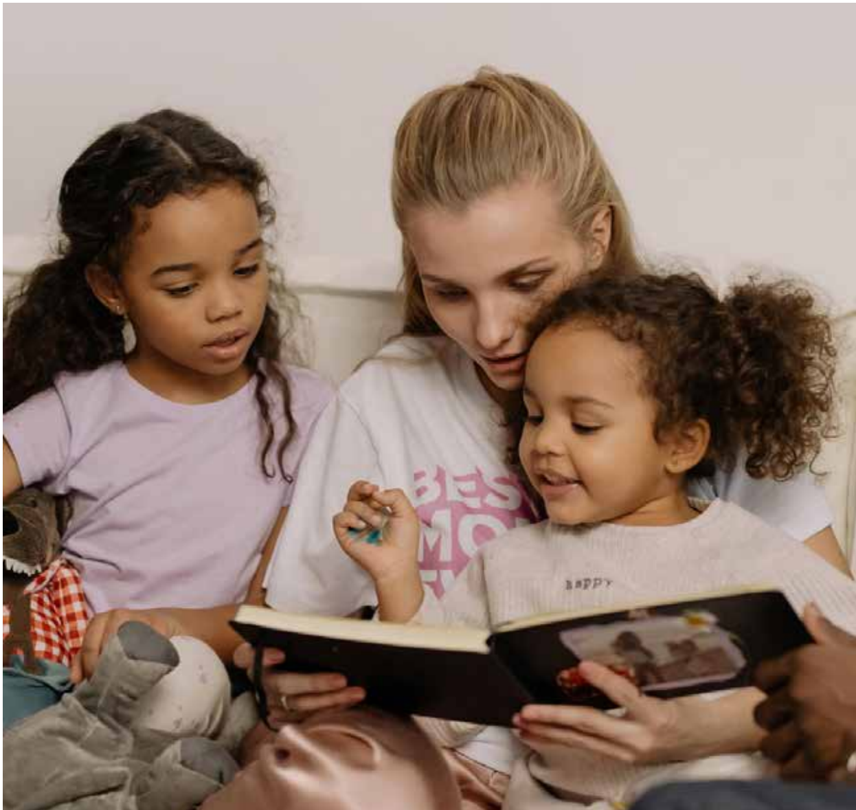
La mujer sabia edifica o construye su casa, la mujer necia con sus manos la destruye.

■ ¡Queridas lectoras, es hora de sumergirnos en un viaje de sabiduría y reflexión en la construcción de nuestro hogar!. En este artículo, exploraremos cómo el temor a Dios y la sabiduría influyen en nuestra vida diaria como mujeres.