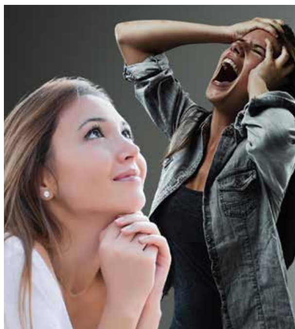
Es exitosa porque usa la disciplina y la inteligencia.

Veamos entonces como mujer, cuál debe ser mi rol en todo esto, con qué actitud lo asumo, a dónde puedo llegar?