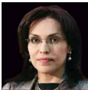
POR: VIVIANE MORALES EXFISCAL GENERAL DE LA NACIÓN

“El proceso de decapitación, paralización y destrucción paulatina de las Fuerzas Armadas de Colombia realizado por Gustavo Petro puede asimilarse a un golpe de estado de estos que se dan sinuosamente.”